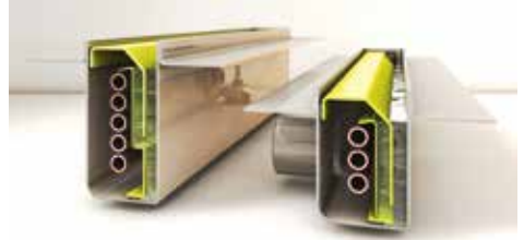
Kleiner Rohrwärmetauscher für Duschen

Bei der Wärmerückgewinnung aus dem Duschwasser (System Joulia) werden die Wärmetauscher direkt in die Duschrinne integriert. Die so dem abfliessenden Duschwasser entzogene Wärme wird auf das Kaltwasser übertragen und damit bis zu 50 Prozent Energie für die Aufheizung des Frischwassers eingespart.