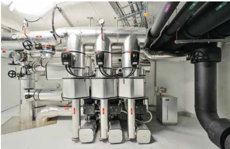
Heizzentrale des Wärmeverbundes Casino Aarau