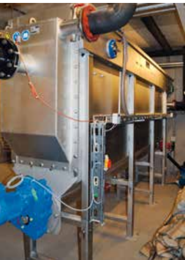
Abwasserwärmetauscher im Keller des Altersheims

Das Abwasser aus den Wohnungen, Küchen und Bädern wird in einem Sammelschacht gefasst, gesiebt und anschliessend über einen Wärmetauscher mit vollautomatischer, mechanischer Reinigung geleitet. Dieser wurde im Keller des Gebäudes neben der Wärmepumpe installiert. Dort wird dem ca. 20°C warmen Abwasser die Energie entzogen und der Gebäudeheizung zugeführt. Dank moderner Bautechnik ist es möglich, den Abwasserschacht in direkter Nähe des Gebäudes zu platzieren, ohne die Bewohner durch Geruchsemissionen zu belästigen. Damit kann das Kompetenzzentrum rund 20 Prozent seines Wärmebedarfs mit der Abwasserwärmepumpe decken.