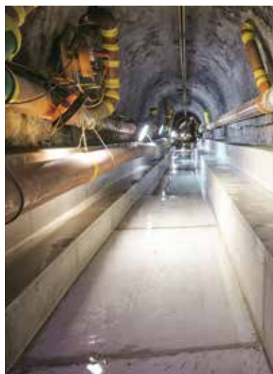
Abwasserkanal mit Sohlenwärmetauscher