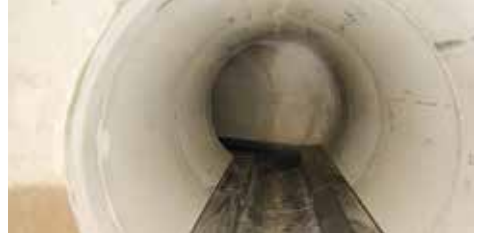
Sohlenwärmetauscher am Boden eines Abwasserkanals

Der Wärmetauscher kann entweder im Abwasserkanal selbst installiert werden (Sohlenwärmetauscher), oder das Abwasser wird für die Wärmeentnahme in einen externen Schacht umgeleitet.