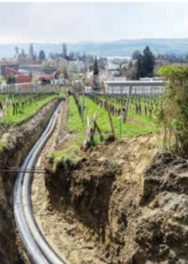
Leitungsbau Wärmenetz Uetikon am See

werkeigenen Abwasserreinigungsanlage geklärt und seit dem Jahr 2014 zur Beheizung diverser Gebäude und zur Warmwasserbereitstellung genutzt. Aufgrund der beengten Verhältnisse vor Ort wurde die Heizzentrale für den Wärmeverbund ausserhalb des Industrieareals erstellt. Zum Einsatz kommt dabei eine Ammoniak-Wärmepumpe mit einer Leistung von 1 MW. Das auf mindestens 70°C erwärmte Heizungswasser wird über eine neu erstellte Fernwärmeleitung in das Dorf geführt und verteilt. Die angeschlossenen Liegenschaften, u. a. das Pflegeheim «Haus Wäckerling», werden damit ganzjährig mit 80 Prozent CO 2 -neutral erzeugter Wärme für Heizung und Warmwasser versorgt. Zudem wurde die ganze Technik vorausschauend so dimensioniert, dass bei einer späteren Erweiterung Platz für eine weitere Wärmepumpe vorhanden ist und der Wärmeverbund auch mit Seewasser betrieben werden kann – dies falls die Zeochem AG dereinst als Lieferantin ausfallen sollte.