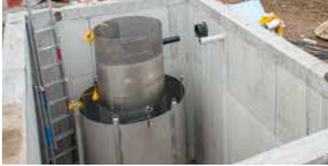
Wärmetauscher in einem Schacht

Bei dieser Variante wird das gesamte hausinterne Abwasser vor Einleitung in die öffentliche Kanalisation in einem Schacht gesammelt und ihm dort die Wärme entzogen.