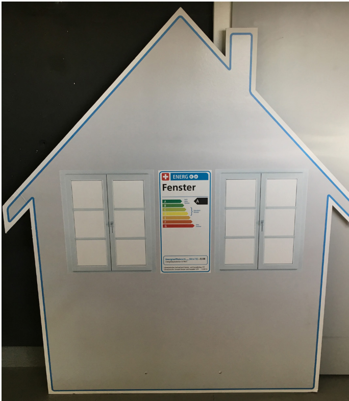
Grösse: 1470mm breit, 1670mm hoch Sujet: „Fenster-Energieetikette“

Die Kartonsteller zeigen Musterenergieetiketten und können als Gesprächsaufhänger auf einem Messestand platziert werden.