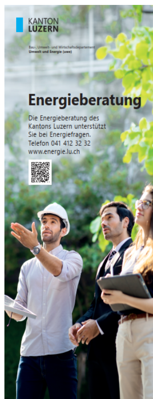
Grösse: 850x2000mm "Energieberatung"

Der Kanton Luzern stellt für Partner (Gemeinden, Firmen etc.) Ausstellungsmaterial für die Promotion der Energieberatung und des Förderprogramms zur Verfügung.