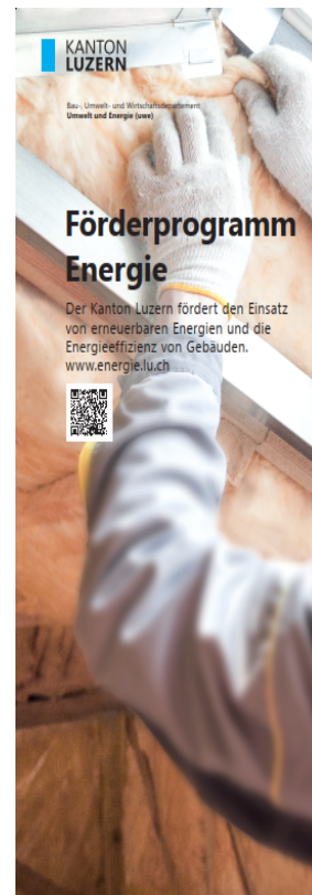
Grösse: 850x2000mm "Förderprogramm"